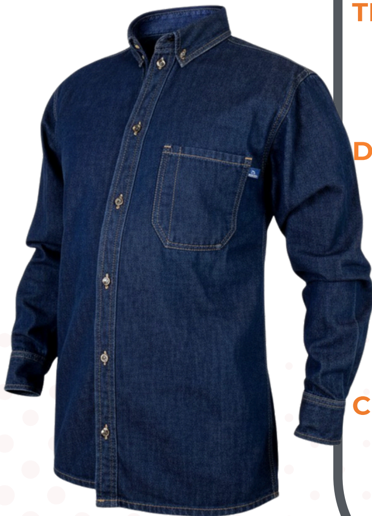
IMAGEN DESCRIPTIVA, DETALLES PUEDEN VARIAR